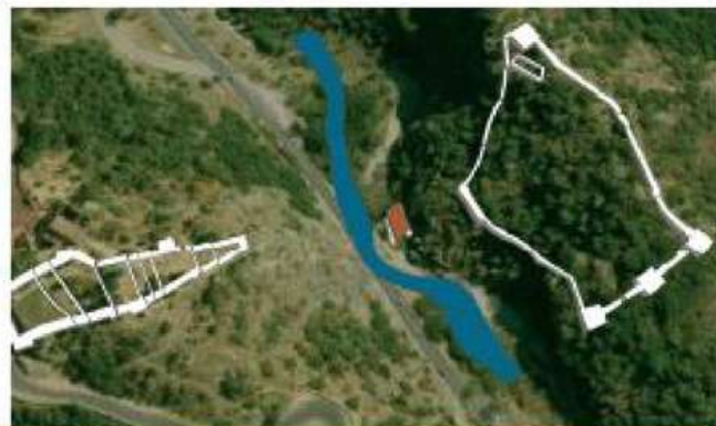
Hypothèse de reconstitution en 3D des forteresses romaines

Un exemple de fortifications unique en Europe